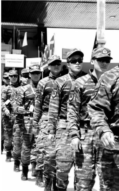
参加国际特种兵比武的中国队队员入场

提起“雪豹突击队”,稍有军事常识的人应该都不会感到陌生。雪豹感官敏锐,性情机警,行动敏捷,善攀爬、跳跃,捕食方式以伏击式猎杀为主,辅以短距离快速追杀,凶猛且精准。以“雪豹”命名,寓意自在不言之中。